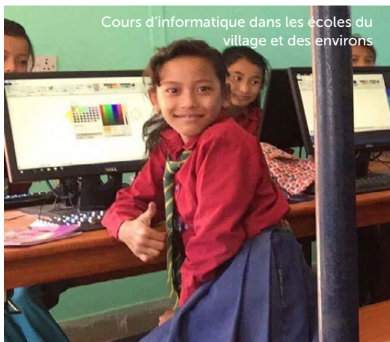
Cours d'informatique dans les écoles du village et des environs