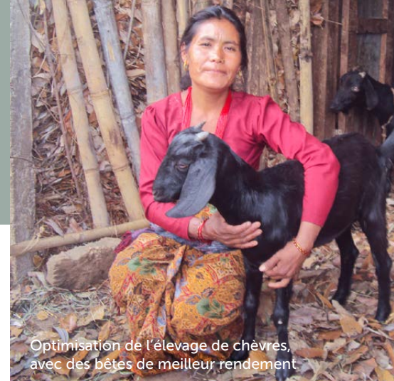
Optimisation de l'élevage de chèvres, avec des bêtes de meilleur rendement