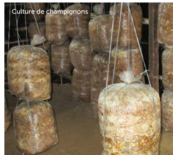
Culture de champignons