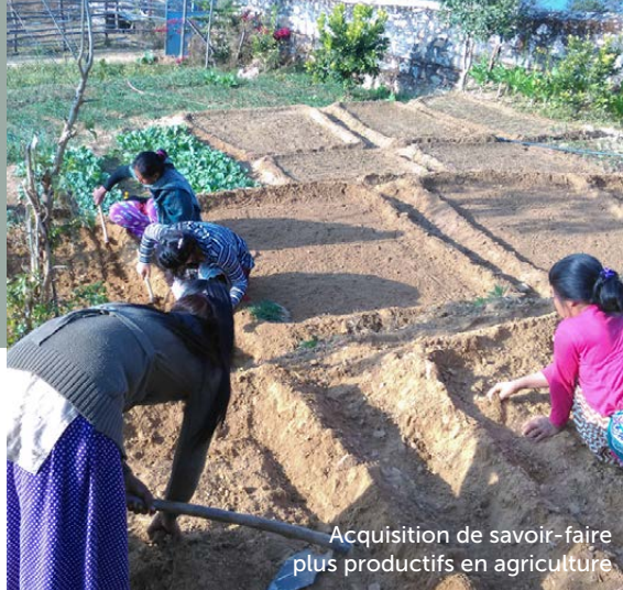
Acquisition de savoir-faire plus productifs en agriculture

Voici quelques activités au centre Food for People au Népal qui ont contribué à renforcer la communauté avec l'aide de la Fondation.