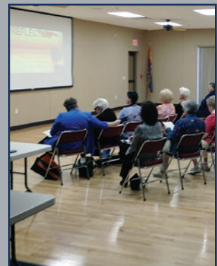
Sun City, Arizona