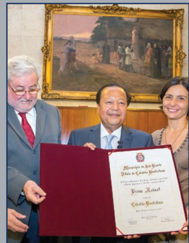
San Paolo (Brasile)