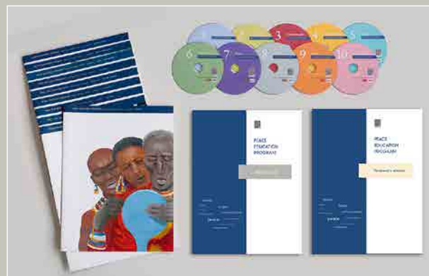
Les brochures et DVD utilisés pour le PEP